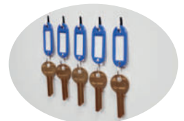
Schlüsselhaken im Inneren