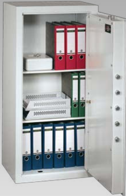
Abb.: MNO 12