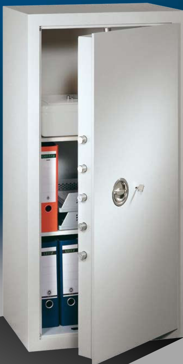
Abb.: MNO 12