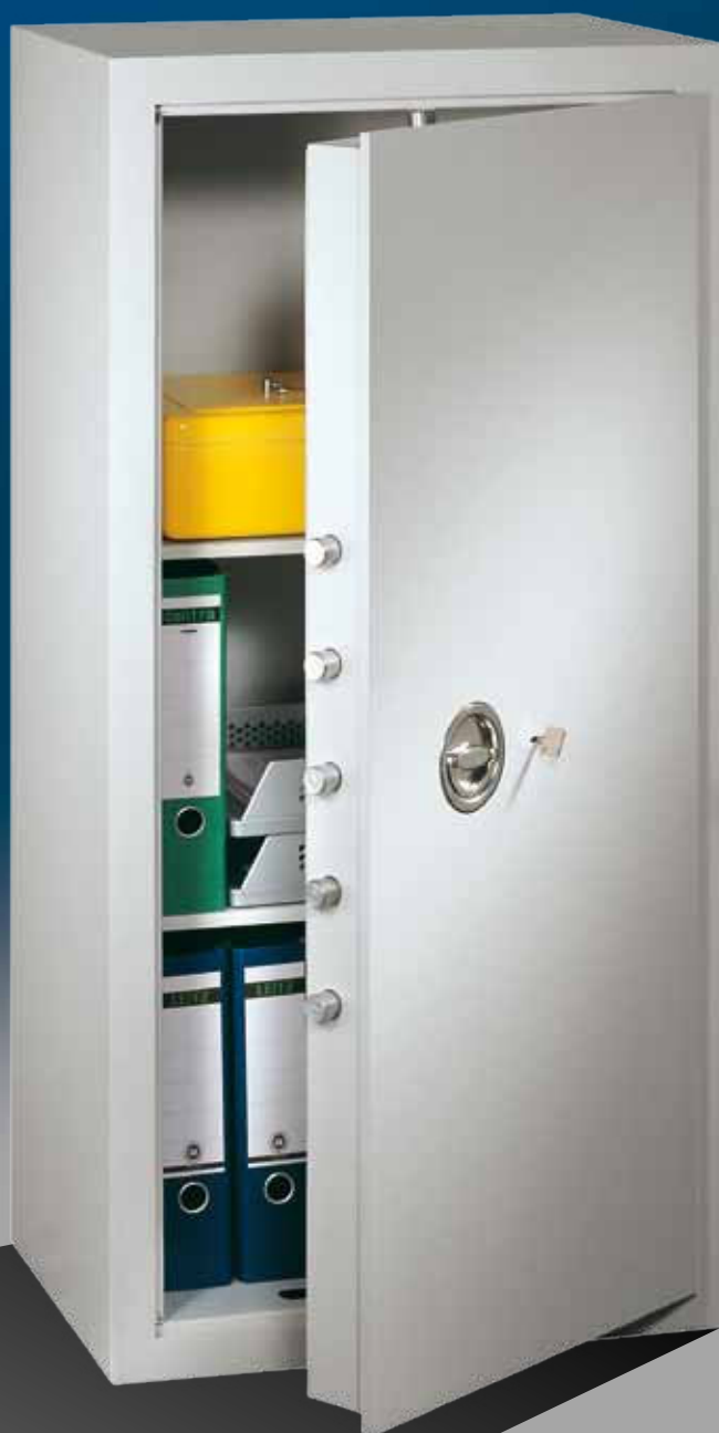
Abb.: MVO 12