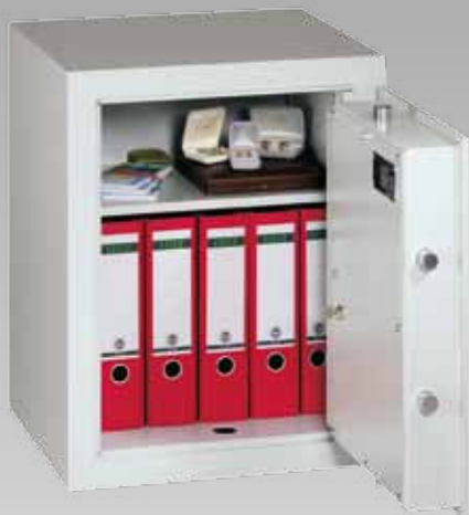
Abb.: MVO 6