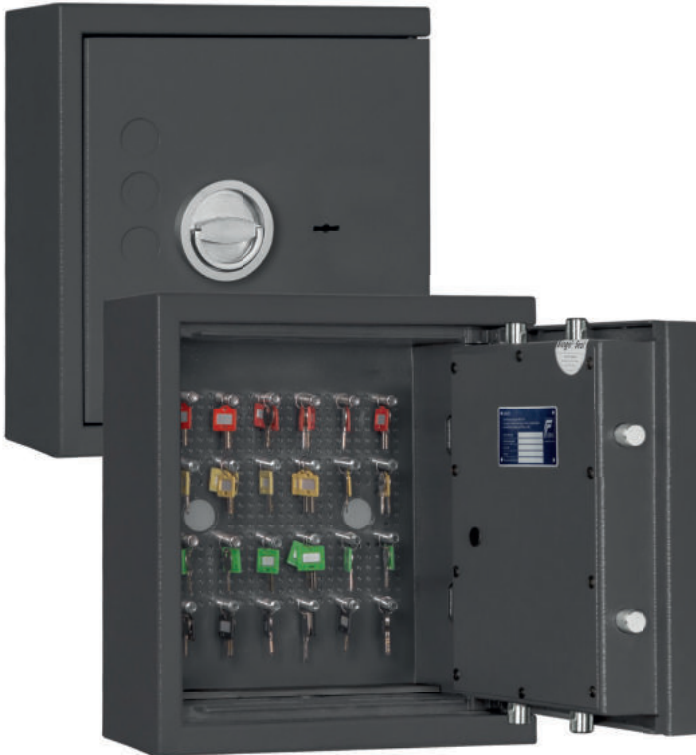
STL 24 Graphitgrau • graphite grey Dekoration nicht im Lieferumfang enthalten • decoration not included in the delivery

🇩🇪 Wertschutz- und Schlüsseltresor STL 24 gem. Widerstandsgrad 0 nach EN 1143-1 ist ideal zur gewerblichen Nutzung und ermöglicht die übersichtliche Sortierung der (Auto-) Schlüssel. Geeignet zur Aufbewahrung von bis zu 24 Schlüsseln. Optimal zur Wandmontage geeignet.