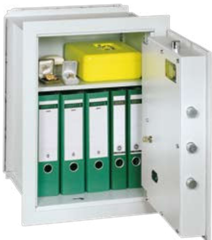
Abb.: VCO 6