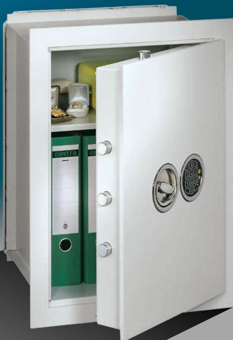
Abb.: VCO 6 (mit Sonderausstattung EZ LG Basic versenkt)